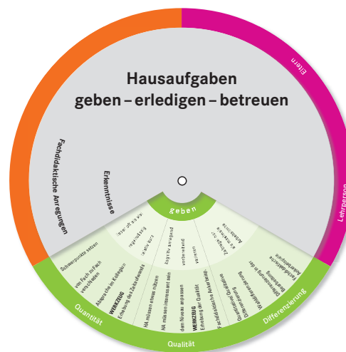
Der Hausaufgabenkreis ist im Rückseitenumschlag eingesteckt.

Die Broschüre «Hausaufgaben – geben, erledigen, betreuen» geht solchen widersprüchlichen Positionen und Ungereimtheiten auf den Grund und bietet Lehrpersonen aktuelles Orientierungswissen zum wichtigen Thema der Hausaufgaben an.