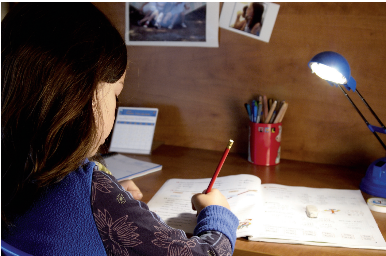
Schülerinnen und Schüler brauchen einen fixen Rahmen, damit sie die Hausaufgaben effizient erledigen können.

Schülerinnen und Schüler mit Schwierigkeiten bei ihrer Selbststeuerung schaffen es in der Regel nicht, alle Tipps gleichzeitig zu beachten. Während einer bestimmten Zeitspanne könnten die Impulse 1 und 2 im Zentrum stehen, indem etwa auf entsprechenden Karten angekreuzt wird, ob die Schülerin oder der Schüler diesen Tipp umgesetzt hat oder nicht. Später könnte der Aspekt der Ablenkung (Punkt 3) und Sorgfalt (Punkt 4) besprochen werden.