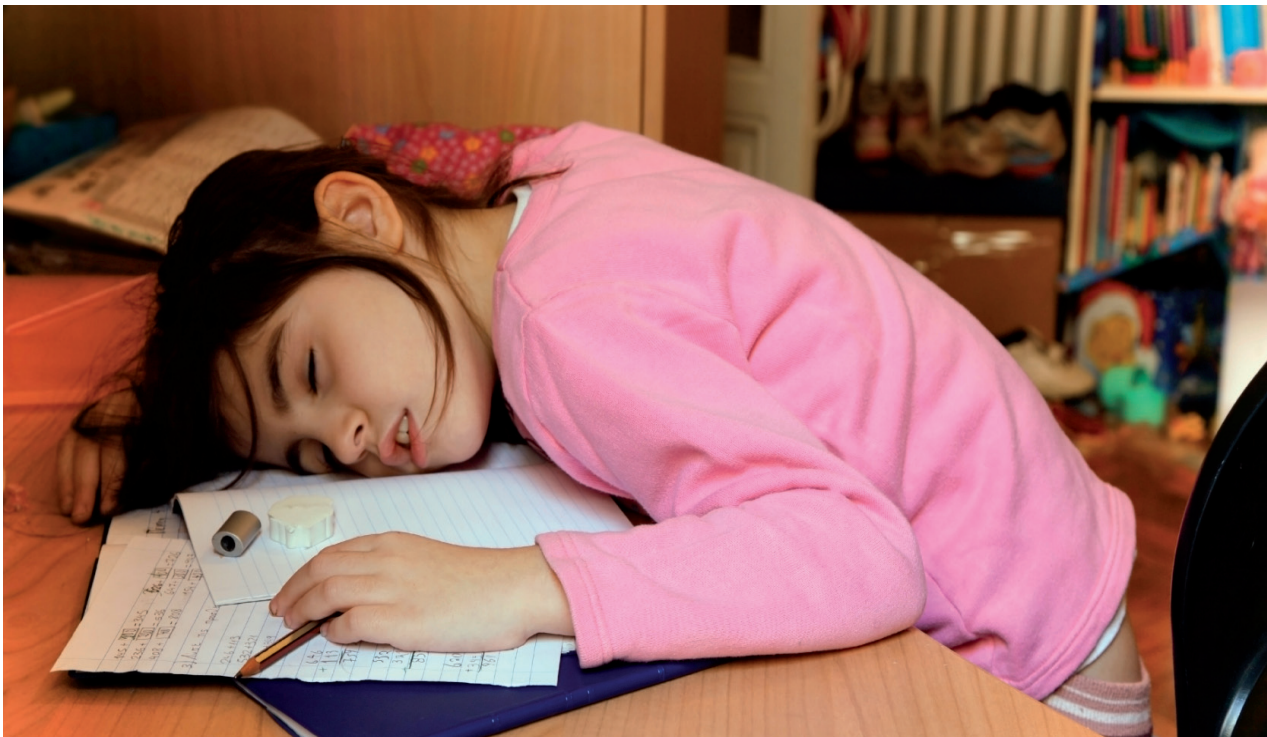
Wer zu lange an den Hausaufgaben sitzt, lernt tatsächlich weniger.

Diese Praxis ist manchmal auch bei individualisierten Unterrichtsarrangements wie Wochen- oder anderen Arbeitsplänen zu beobachten. Langsamere Schülerinnen und Schüler werden von einem Über-