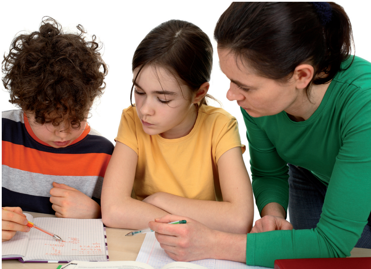
Die Mitarbeit der Eltern sollte so gering wie möglich gehalten werden. Elterliche Einmischung und Kontrolle sind kontraproduktiv.

Bei Elterngesprächen Hinweise geben. Problematische Entwicklungen können auch aus Elterngesprächen entstehen, in denen Leistungsprobleme angesprochen werden, oder wenn das Zeugnis unbefriedigend ausfällt. Geht die Lehrperson in solchen Situationen nicht speziell darauf ein, wie sich die Eltern verhalten sollen, dann können negative Wechselwirkungen entstehen.